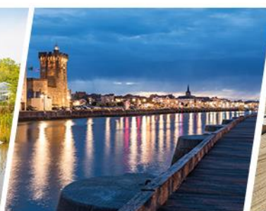
LES SABLES D'OLONNE