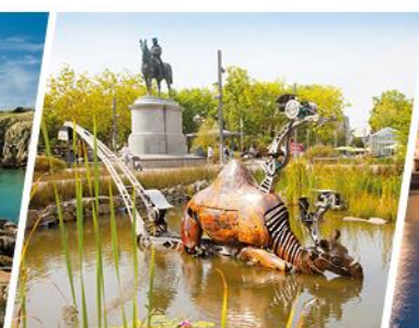
LA ROCHE SUR YON