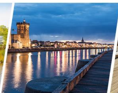
LES SABLES D'OLONNE