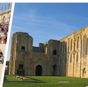
ABBAYE DE MAILLEZAIS