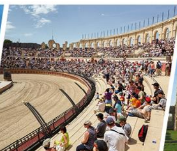
LE PUY DU FOU