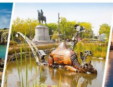
LA ROCHE SUR YON