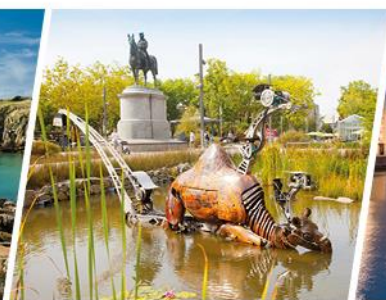
LA ROCHE SUR YON